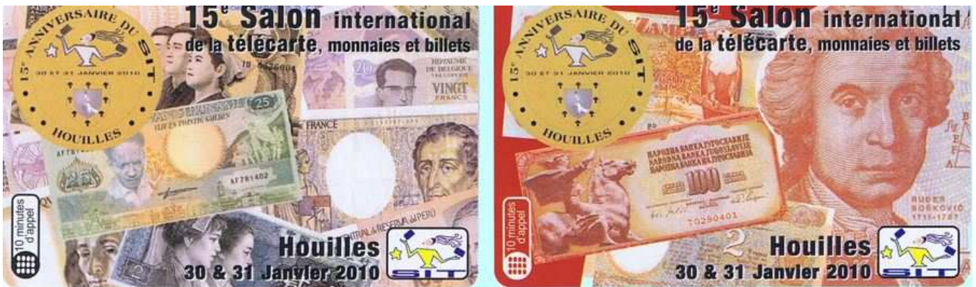
Télécartes: Tirage 400 et 1 000 exemplaires

Notre 15ème salon a fermé ses portes le dimanche à 16 heures. Cette édition aura été un succès avec une grande affluence et une excellente ambiance tout au long des 2 jours. Dès le samedi de bonne heure les collectionneurs patientaient au 2 e étage de la salle Ostermeyer en échangeant leurs cartes autour d'un café chaud bien réconfortant en cette journée enneigée. Les 2 navettes mises à